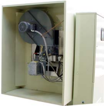
Brûleur à pétrole industriel