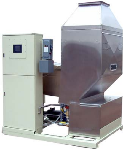
Armoire de commande, chambre de pulvérisation et réservoir