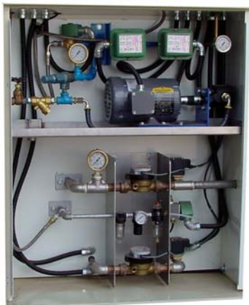
Circuit pétrole et compteurs d'eau

Construit sur les bases du "Sahara", le plus puissant des humidificateurs, le modèle HU-80-1545 "Sahara Lite" amène cette technologie des générateurs de forte humidification dans la gamme des usines de capacités ou de budgets plus faibles. Avec une capacité d'évaporation supérieure de 50% par rapport à ses prédécesseurs de la gamme HU-60, il est vite devenu évident qu'il est un acteur important parmi les générateurs d'air humide.